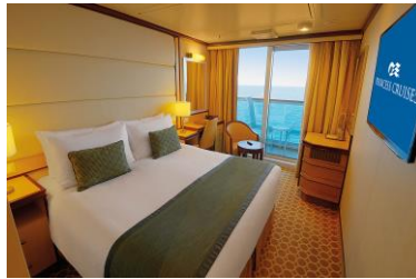
露台客房 面積約 222 平方英尺