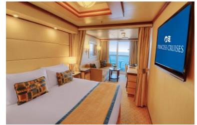
迷你套房客房 面積約 319 平方英尺