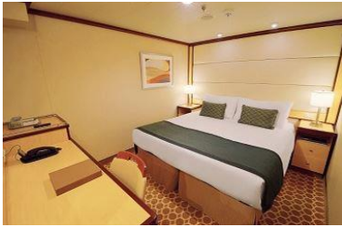
內艙客房 面積約 166 平方英尺