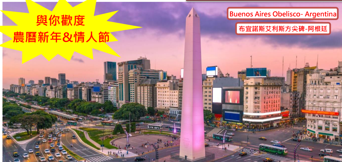
Buenos Aires Obelisco- Argentina