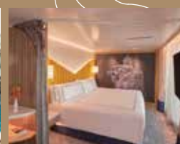
超過40間寬敞豪華套房