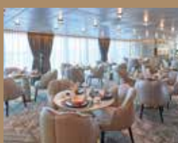
精緻豐盛的免費餐飲

「The Palace 皇宮」設有超過40間尊貴套房，包括2間皇宮庭苑別墅以及專屬泳池、酒廊及餐廳，致力以豪華「船中船」概念為旅客打造薈萃精品郵輪特色的尊屬天地，匯聚絕無僅有的奢適生活體驗。賓客可奢享精緻豪華的意式風格套房和皇宮餐廳的亞洲及歐洲美饌，隨時候命的星夢管家團隊，以體貼周到的服務及豐厚全面的專業知識為旅客帶來無與倫比的尊貴享受。