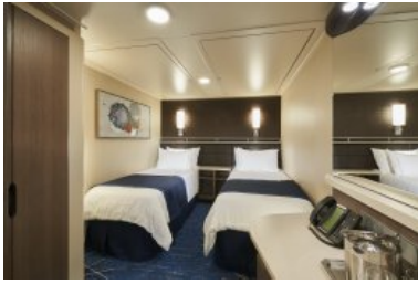
內艙客房 面積約 135 平方英尺