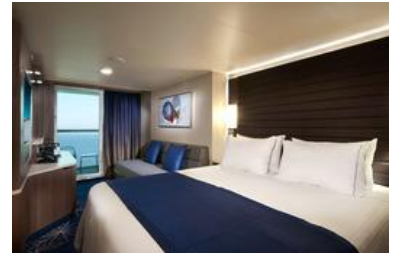
露台客房 面積約 218 平方英尺