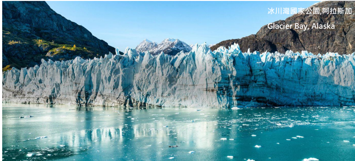
冰川灣國家公園, 阿拉斯加 Glacier Bay, Alaska