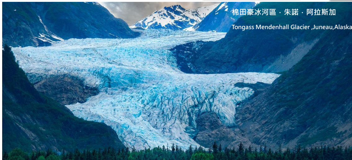
棉田豪冰河區 · 朱諾 · 阿拉斯加 Tongass Mendenhall Glacier, Juneau, Alaska