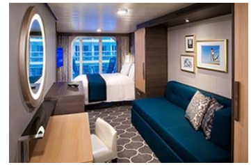
露台房 面積約 182 平方呎