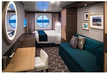
海景房 面積約 179 平方呎