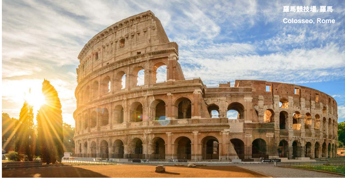
羅馬競技場, 羅馬 Colosseo, Rome