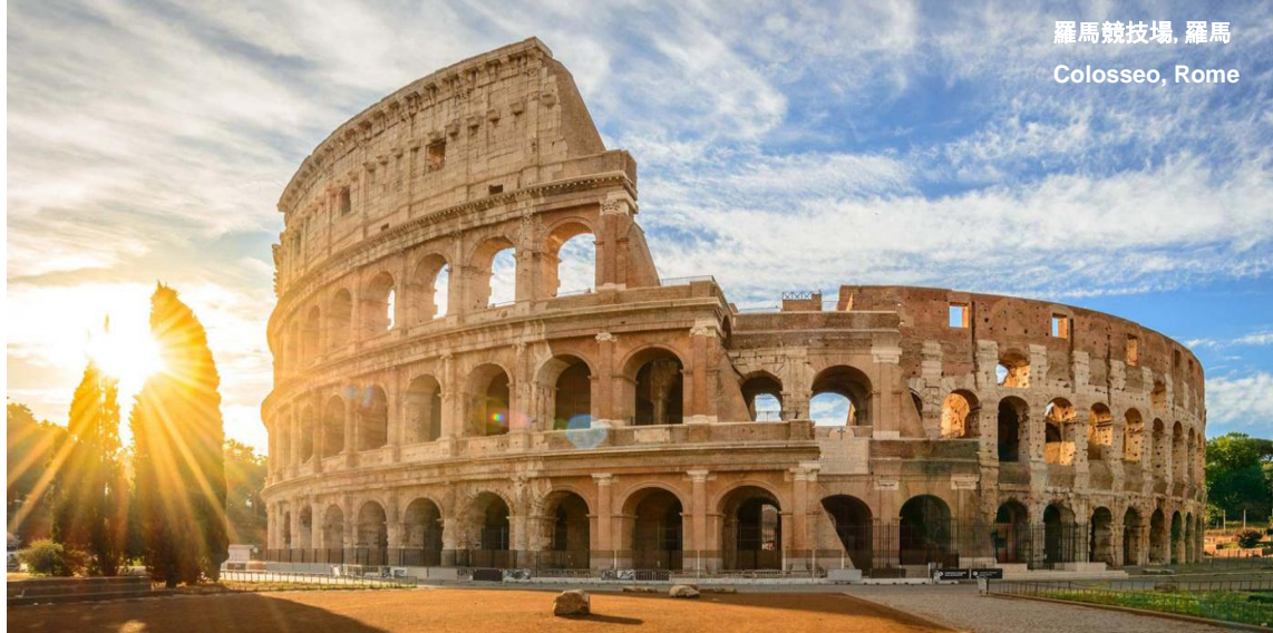
羅馬競技場, 羅馬 Colosseo, Rome