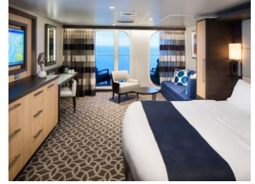
標準套房 面積約 267 平方呎