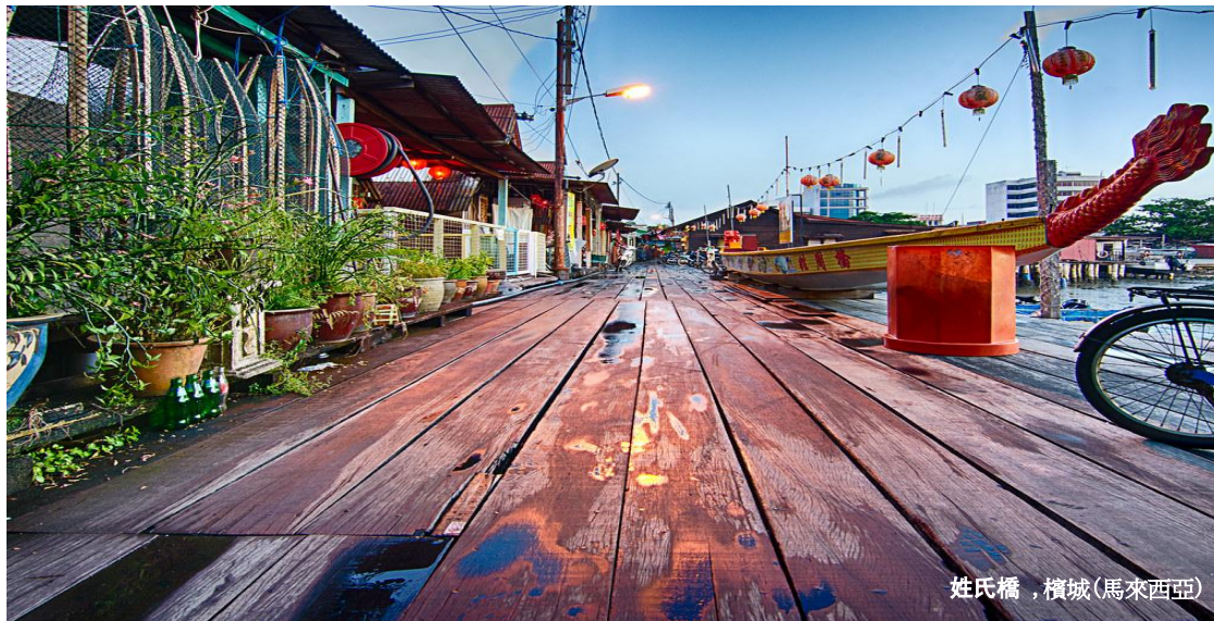
姓氏橋, 檳城(馬來西亞)