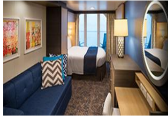
露台房 面積約 198 平方呎