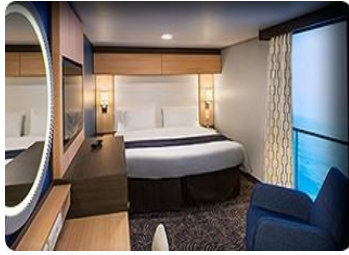
內艙虛擬陽台房 面積約 166 平方呎