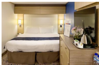
內艙房 面積約 166 平方呎