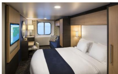
海景房 面積約 182 平方呎