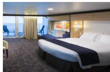
露台房 面積約 198 平方呎