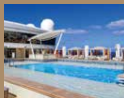
私密專屬的各項設施